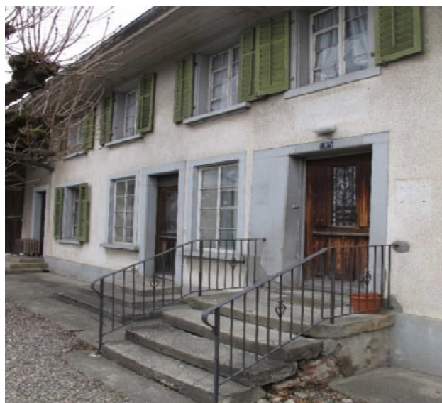
Mellingerstrasse 8, Fischbach-Göslikon: Aufnahme: 13. Februar 2017

Was viele nicht wissen: Die Post befand sich lange in der Liegenschaft Mellingerstrasse 8, wo früher auch eine Backstube war.