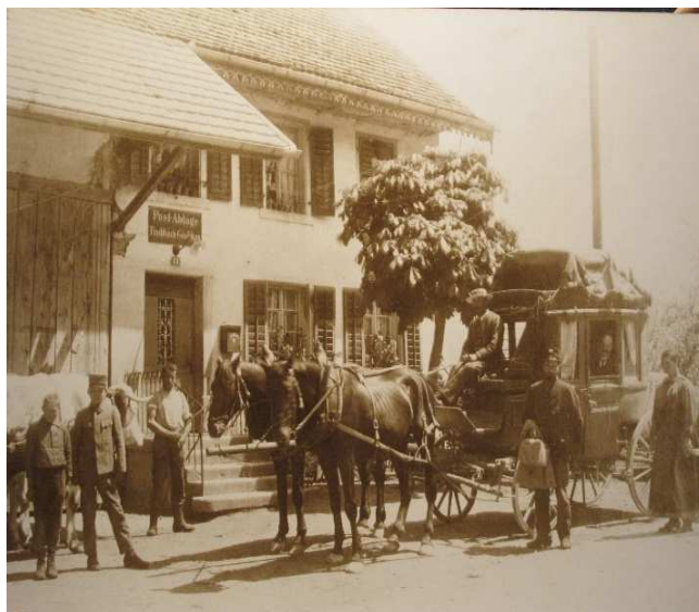
Mellingerstrasse 8, Fischbach-Göslikon: Aufnahme: vermutlich Ende 19. Jahrhundert

Ida Staubli-Seiler (ehemalige Posthalterin) und Irene Perrotta überliessen der Gemeinde Fischbach-Göslikon viele interessante Dokumente (siehe Bild oben rechts), die zum Teil aus dem 18. Jahrhundert stammen und historischen Wert haben. Diese Belege geben einen Einblick in die Zeit vor, während und nach der Französischen Revolution im Dorf und im unteren Aargauer Reusstal. Bemerkenswert ist dies insbesondere deshalb, weil das Freiamt bis zum Einmarsch der Franzosen im Jahr 1798 ein Untertanengebiet der Alten Eidgenossenschaft war und 1803 der neue Kanton Aargau gegründet worden ist. Der Gemeinderat dankt den beiden Einwohnerinnen für die Übergabe dieser Dokumente in das Gemeindearchiv.