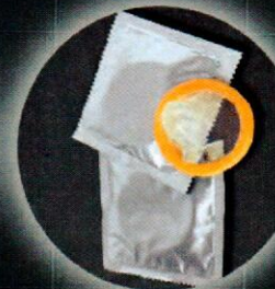
Kondome und viele mehr ...