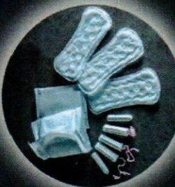
Tampons und Binden