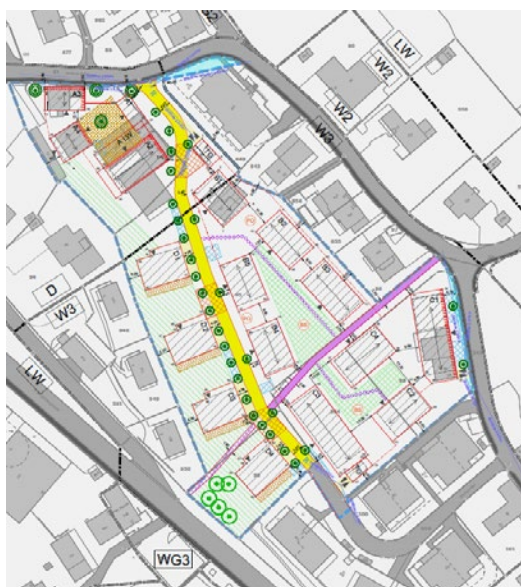
Gestaltungsplan öffentliche Auflage

Nach Abschluss der Verhandlungen befindet der Gesamtgemeinderat über die Anpassungen der Planung bzw. über die Abweisung der Einwendungen und beschliesst den Gestaltungsplan. Der Beschluss des Gemeinderates ist 30 Tage zu publizieren und wird nach Ablauf der Frist der kantonalen Verwaltung zur Genehmigung eingereicht. Zur Erlangung der Rechtskraft wird die Planung durch den Regierungsrat genehmigt.