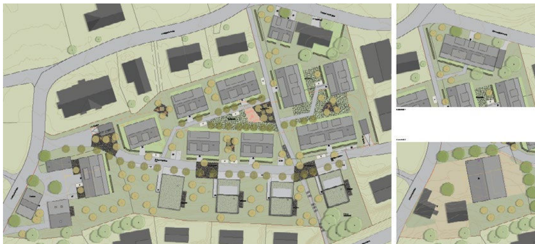
Bebauungs-/Freiraumkonzept mit Variante Neubau C1 und Variante bestehender Bauernhof, Stand öffentliche Auflage