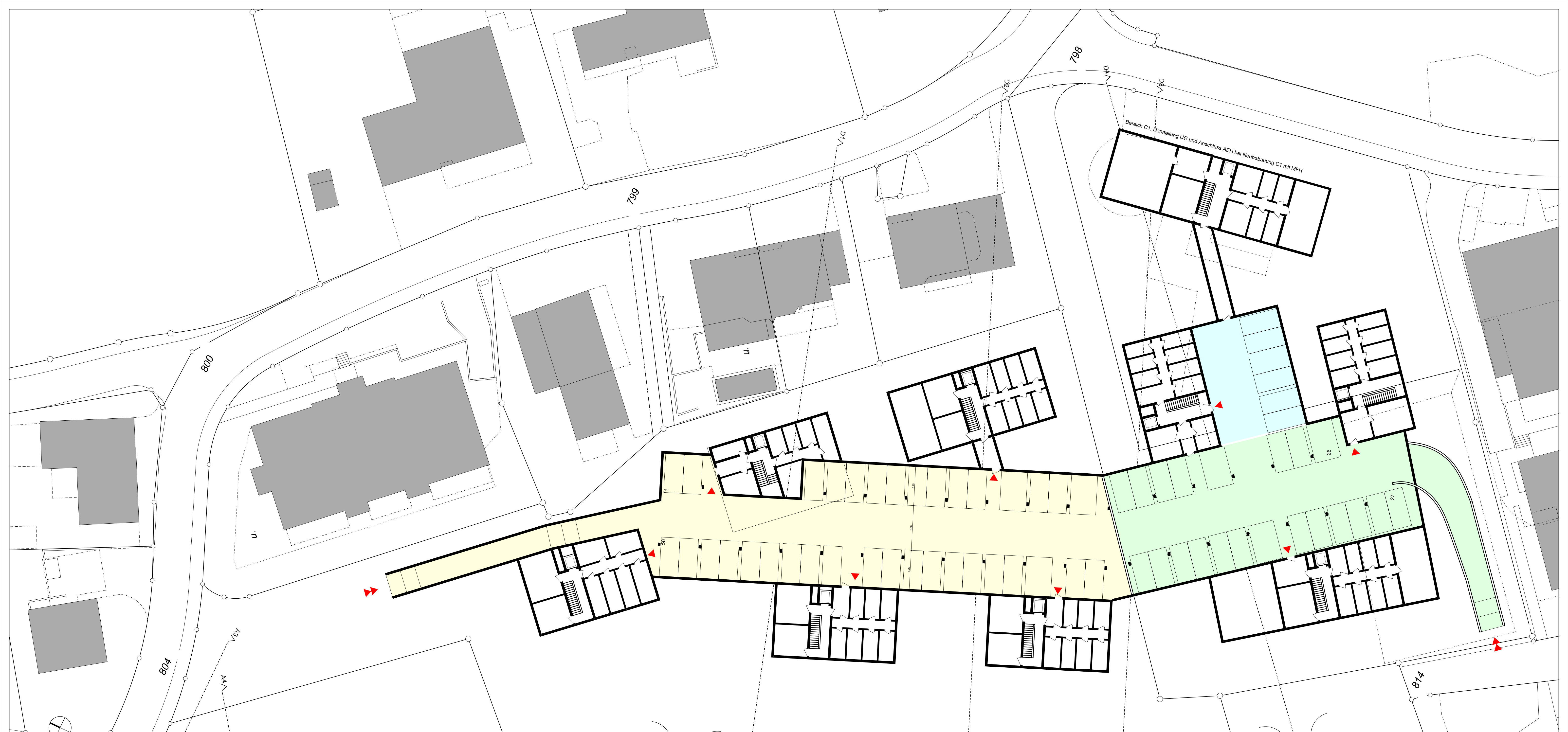
Niveau -1, Gesamtkonzept AEH